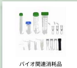
バイオ関連消耗品