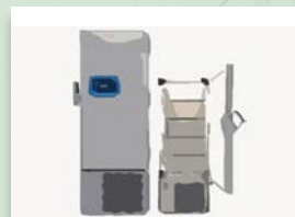
超低温フリーザー